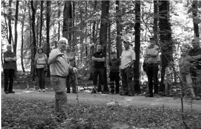
Beliebt sind die Veranstaltungen „Frag den Förster“, die das Kreisforstamt regelmäßig anbietet.

Eine Übersicht aller Termine ist im Internet unter www.rhein-neckar-kreis.de/abindenwald zu finden. Dort stehen auch alle wichtigen Informationen wie Anfahrtswege, Treffpunkte, Dauer der Veranstaltungen und maximale Teilnehmerzahlen. Alle Angebote sind kostenfrei. Für einige Führungen ist eine vorherige Anmeldung erforderlich; entsprechende Hinweise sind bei den jeweiligen Veranstaltungen vermerkt.