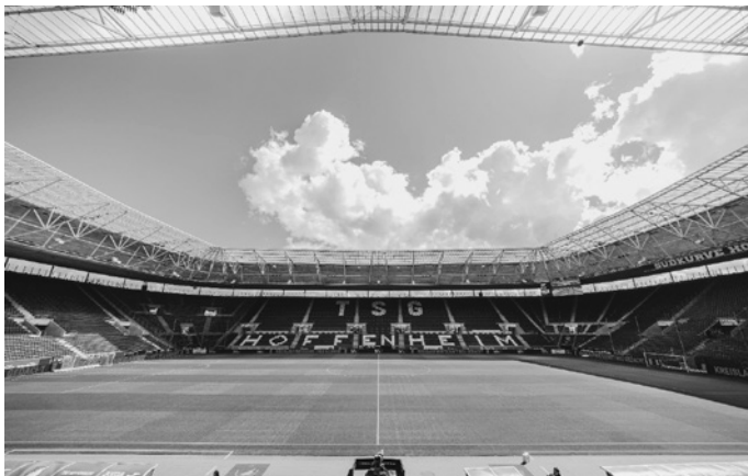
Stadionluft schnuppern bei der Arena-Führung in der PreZero Arena.

Wo sonst die Profis der TSG 1899 Hoffenheim auflaufen, öffnet sich für Besucher ein exklusiver Blick hinter die Kulissen: Die Arena-Führung in der PreZero Arena bietet Fußballbegeisterten, Familien und Neugierigen ein ganz besonderes Erlebnis – mitten in der Sinsheimer Erlebnisregion.