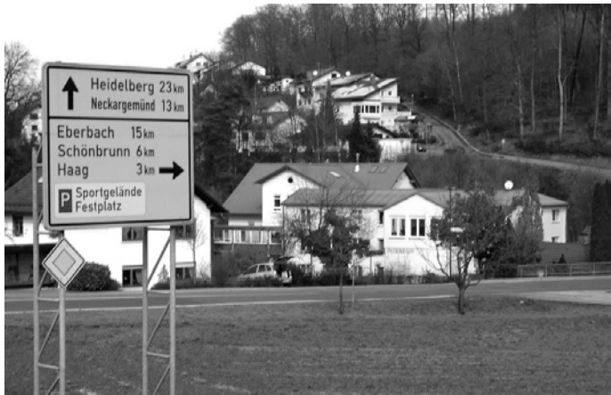
Foto: Feierabendhaus (Missionsheim) vom „Bund der Missionsschwestern e.V.“ im Ostring. Aufnahme an der Ortseinfahrt, von Osten kommend. Einige Gebäude im „Oberen Igel“ sind auch auf dem Foto zu sehen.