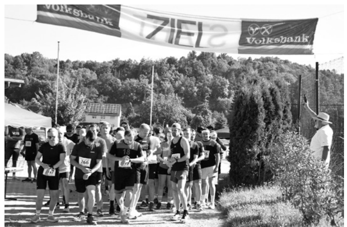
Am letzten Sonntag im Juni heißt es wieder „Start frei“ beim Schreinerdorflauf in Eschelbronn.

Für Speisen und Getränke ist im Vereinsheim gesorgt. Zuschauer sind herzlich eingeladen, die Teilnehmer entlang der Strecke anzufeuern. Anmeldungen und weitere Informationen sind direkt beim Turnverein Eschelbronn unter www.turnverein-eschelbronn.de/ schreinerdorflauf erhältlich.