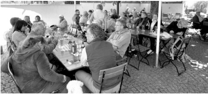
Mittagessen in der Bahnhofsgaststätte in Mauer

Einige hatten danach immer noch nicht genug, und so lief eine zehnköpfige Gruppe sowie die beiden Hunde zunächst nach Mönchzell, wo wir am „Boxenstopp“ an der Lobbachhalle eine Rast mit gesanglichen Einlagen einlegten, bevor es entlang der K4178 zur Klosterkirche bzw. über den Verbindungsweg zurück nach Waldwimmersbach ging. Schön war's wieder – bis nächstes Jahr!