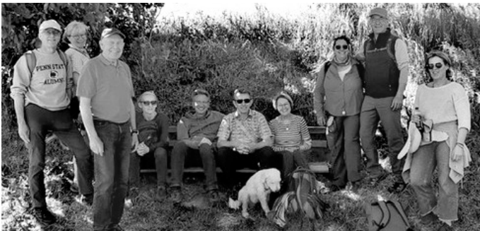
Fototermin auf dem Rückweg zwischen Mauer und Mönchzell