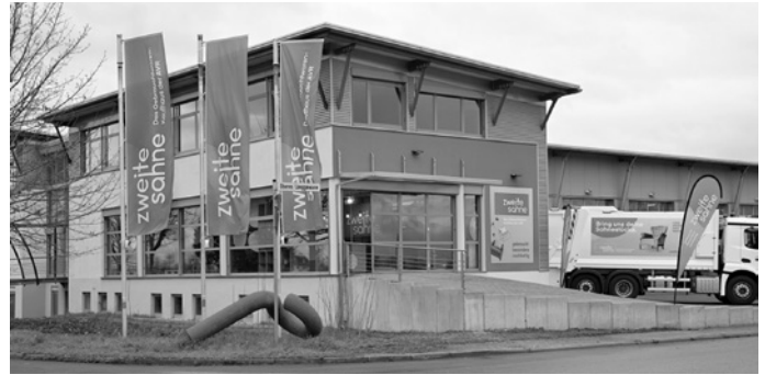
Gut erhaltene Gegenstände können in der „zweiten sahne“ in Dossenheim sowie auf den AVR Anlagen abgegeben werden. In der „zweiten sahne zwo“ in Eberbach ist keine Annahme von Gebrauchtwaren möglich.

Gerade beim Frühjahrsputz gilt daher: Weitergeben statt wegwerfen – und so ganz einfach etwas Gutes für die Umwelt tun.