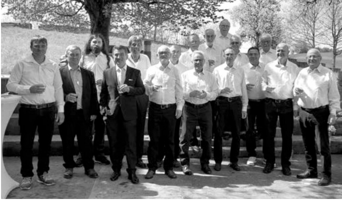
Unser MGV stärkt sich zu seinem Auftritt im Kloster.