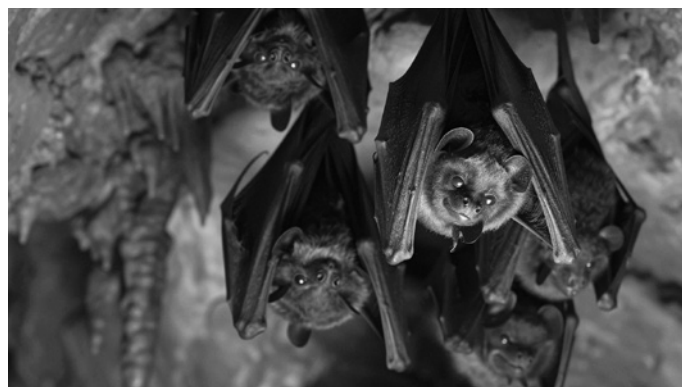
Bei der Fledermausexkursion haben die Besucher die Möglichkeit diese faszinierenden Tiere live zu erleben.

Die Anmeldung sollte mindestens 48 Stunden im Voraus telefonisch oder per E-Mail beim Erlebniszentrum Mühle Kolb erfolgen. Weitere Informationen sind auf der Homepage der Erlebnisregion Mühle Kolb unter: www.erlebniszentrum-muehlekolb.de zu finden.