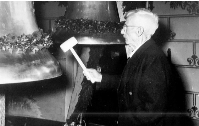
Die Glocken waren auf einem massiven Gestell in der Kirche befestigt und wurden bei der Weihe mit einem Holzhammer angeschlagen.

Die große Glocke kann von der Glockenweihe berichten: „Außer dem katholischen Pfarrer Andreas Nock war Jakob Barth* an der Glockenweihe beteiligt. Zur Weihe der jeweiligen Glocke, wurde diese mit einem Holzhammer angeschlagen. So war der Glockenton gut zu hören.