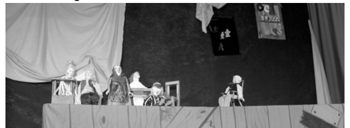
Die Kinder und Erzieherinnen

Am Montag fuhren unsere „mittleren und großen Kinder“ mit dem Bus nach Meckesheim. Dort erwartete uns das Figurentheater, organisiert vom Team des Spielmobils Kraichgau, mit dem Stück „Immer dieser Michel“. Ganz fasziniert wurde den Geschichten von Michel von Lönneberga gelauscht. Voll mit tollen Eindrücken ging es mit dem Bus wieder nach Lobenfeld in den Kindergarten.