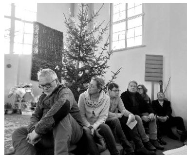
Wer an den Tischen keinen Platz bekam, saß auf den Altarstufen, unter dem Christbaum.

Der Gottesdienst fand in der Kirche in Buschow statt. Die Kirche hat keine Bänke, so konnten Tische und 160 Stühle, auch gleich für die Festversammlung gerichtet werden.