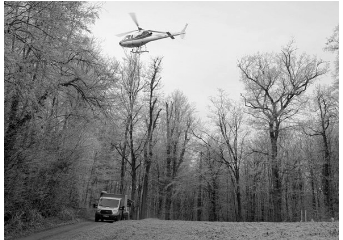
Hilfe für den Wald im Klimawandel: Im Kleinen Odenwald wird die Bodenschutzkalkung per Helikopter fortgesetzt.