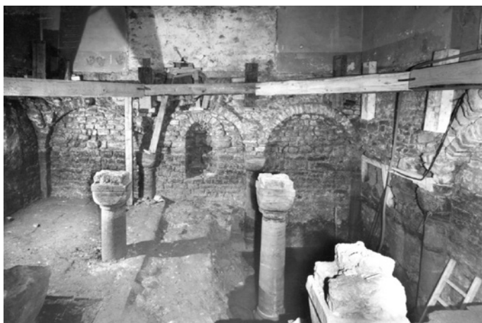
Benediktinerpropstei Wiesenbach während einer Ausgrabung 1980.

In Mittelalter und Neuzeit lebten Nonnen und Mönche in frommen kirchlichen Gemeinschaften in fast jedem größeren Ort. Durch die Reformation im 16. Jahrhundert und die Säkularisierung im frühen 19. Jahrhundert wuchs jedoch die Ablehnung gegenüber dem Ordensleben – Kirchengüter wurden aufgelöst. Während manche Klöster dem sofortigen Abriss zum Opfer fielen, wurden andere zwar zunächst einer neuen Nutzung zugeführt, verfielen aber dennoch allmählich bis sie schließlich fast vollständig aus unseren Ortsbildern verschwanden.